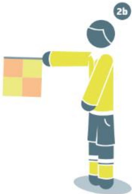
Hors-jeu au centre du terrain