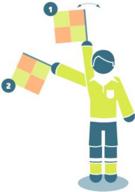
Attacking free kicks