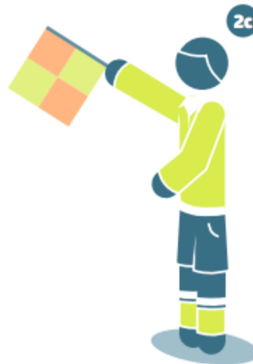
Offside on the far side of the field