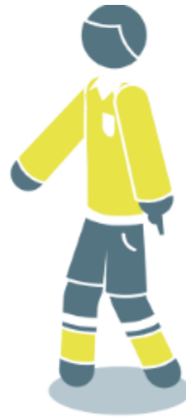
Coup de pied de but