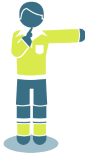
Direct free kick