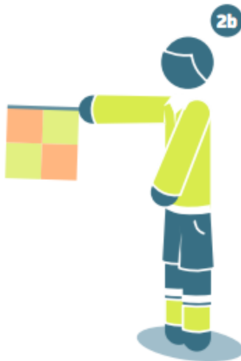
Offside in the middle of the field