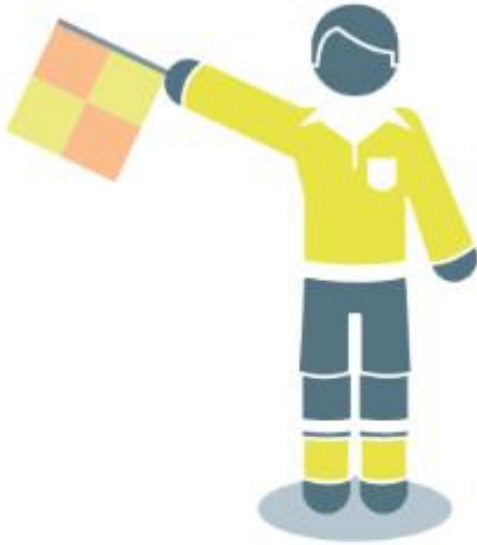
Rentrée de touche pour l'équipe en attaque