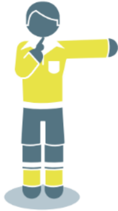
Coup franc direct