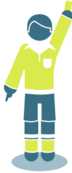
Red and Yellow card