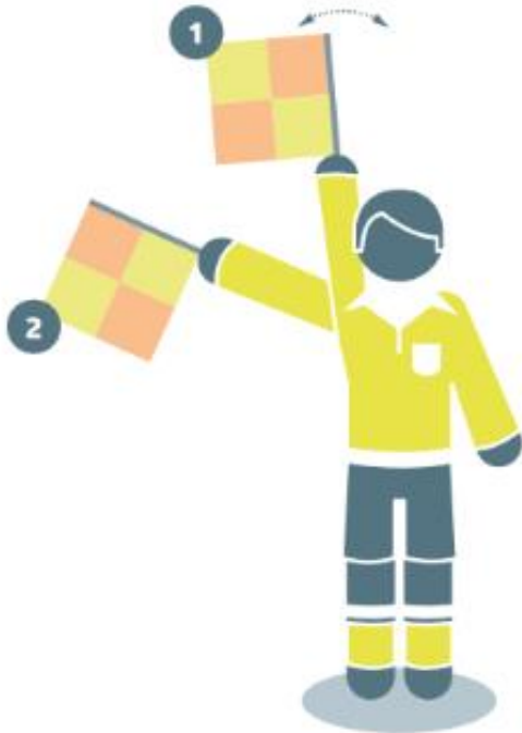
Coup franc pour l'équipe en attaque