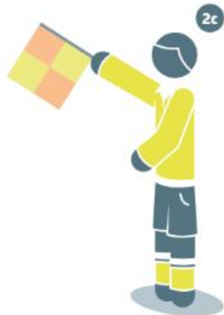
Hors-jeu à l'opposé du terrain