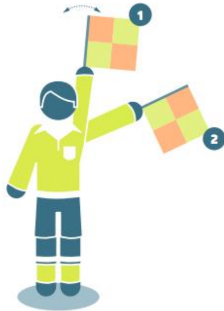
Defending free kicks