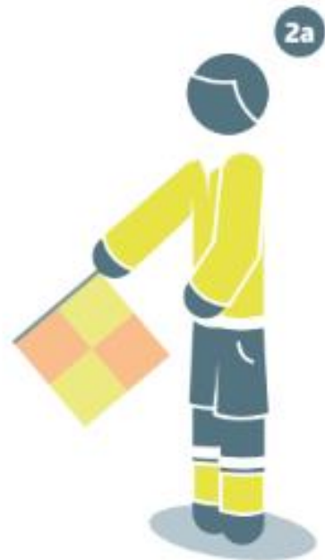
Hors-jeu de ce côté du terrain