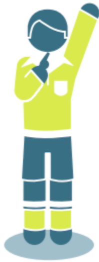
Indirect free kick