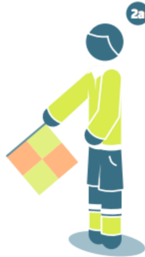
Offside on the near side of the field