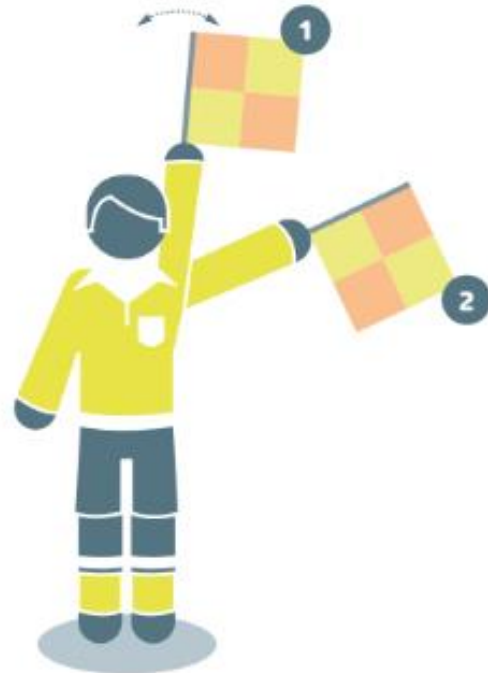
Coup franc pour l'équipe en défense