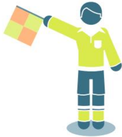
Throw-in for attacker