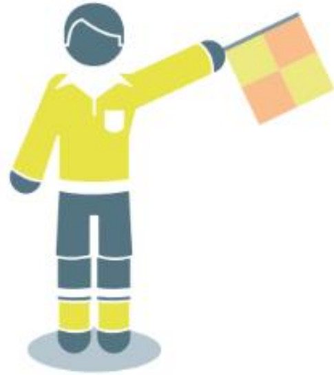
Rentrée de touche pour l'équipe en défense