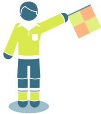
Throw-in for defender