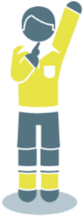
Coup franc indirect