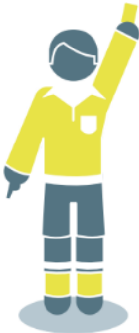
Carton jaune ou rouge